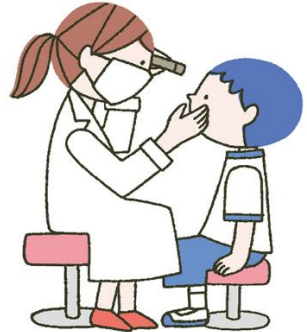
がん かけんしん 眼科検診