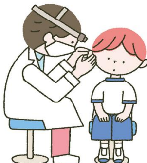
じ び かけんしん 耳鼻科検診