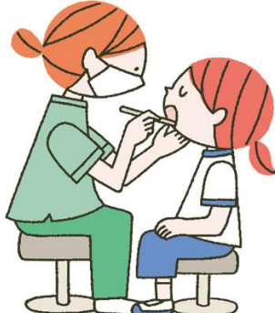
し かけんしん 歯科検診