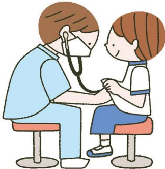
ない かけんしん 内科検診